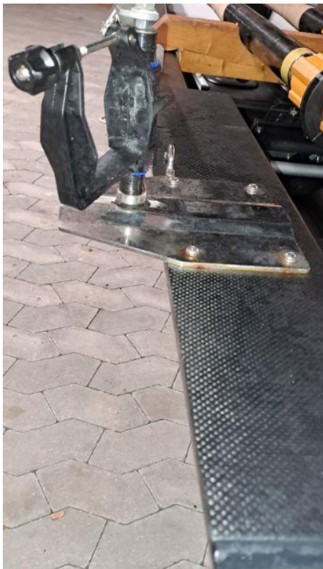
Figur 3 - Indsendt august 2023

På forespørgsel fra Odens Roklub til dommerudvalget fremsendes følgende billeder