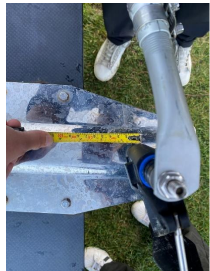
Figur 2 - Måling ved DM 2024

Båden overholder ikke reglerne. Holdet udelukkes/ekskluderes fra løbet og medaljerne inddrages.