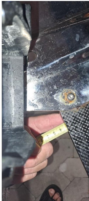
Figur 4 – Indsendt august 2023