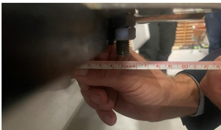
Figur 8 - 2 / 3 plads

2 og 3 plads – Overholder reglerne, billeder fra godkendelse 2023