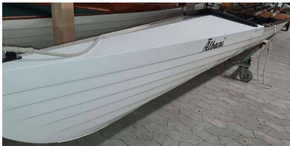
Figur 5 - Indsendt august 2023