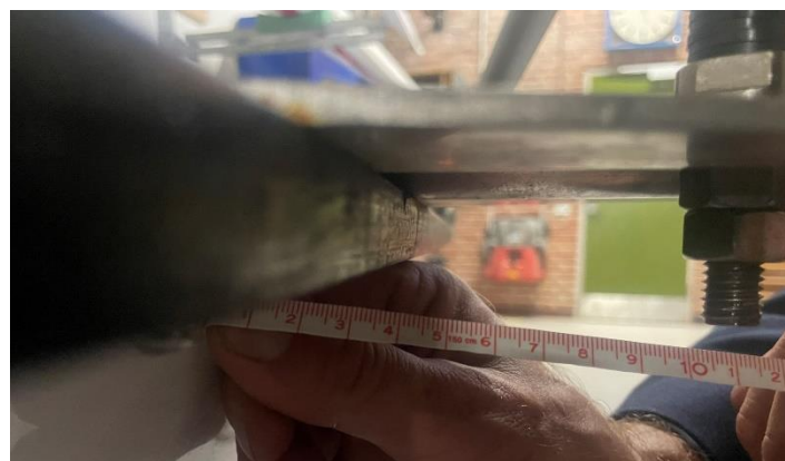
Figur 7 - 1 / 4 plads