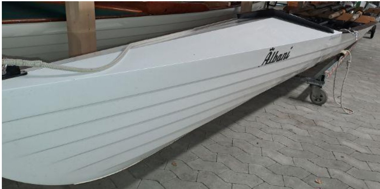
Figur 1 - Billede fra august 2023

I forbindelse med Løb 143 M4+inr. blev dommerkomitéen ved DM 2024, gjort opmærksom på konstruktionen af båden Albani Odense Roklub, der blev benyttet af Bagsværd Roklub.