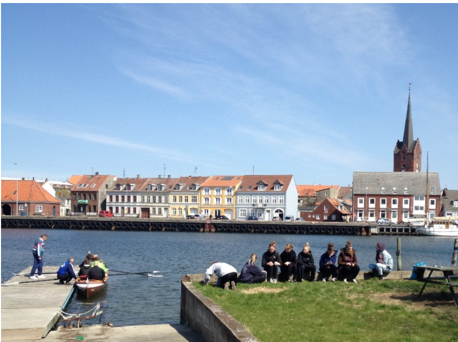
Liv og glade dage ved Nakskov Roklub, da NS Roklub og Nakskov Roklub havde besøg af Nakskov Gymnasium

Der mangler kun en klub for, at der kan meldes fuldt hus i 4. division i denne omgang. Nu må vi så nøjes med ni klubber. Det er ikke den helt store fortællelyst, der præger klubberne i 4. division. Fra nummer et Bagsværd beretter Lone Banke Rasmussen: De første af vores nye roere har rundet 100 kilometer. Derudover har "60+'erne" været på tur til Berlin, hvor de efter sigende har roet en del. Ribe Roklub er tilbage i Motionsturneringen som nummer to i 4. division. I Nakskov Roklub er det morgenroerne og "GRIN", der er en forkortelse af Gamle Roere I Nakskov, der står for broderparten af aktiviteten. Der er fortsat god gang i samarbejdet med Nakskovs anden roklub NS Roklub, og der roes ture med "blandede mandskaber" og med udgangspunkt både i Nakskov Roklub og i NS Roklub. Herudover har de to klubber samarbejdet om at have Nakskov Gymnasium på besøg, hvor de unge mennesker fik mulighed for at stifte bekendtskab med rosportens lyksaligheder.