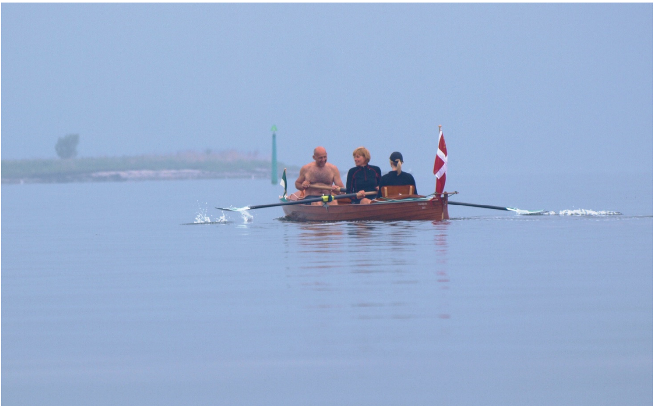
Roklubben ARA på pinselangtur til Haderslev Fjord. Dis og fladt vand ved indsejlingen til Haderslev Fjord.