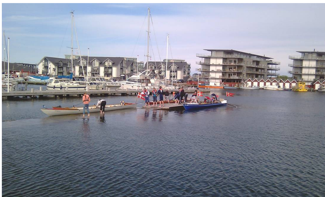
I Nyborg var det højvande, da ungdomsroerne skulle på vandet den 31. maj. Så man måtte ”gå på vandet” for at komme ud at ro.