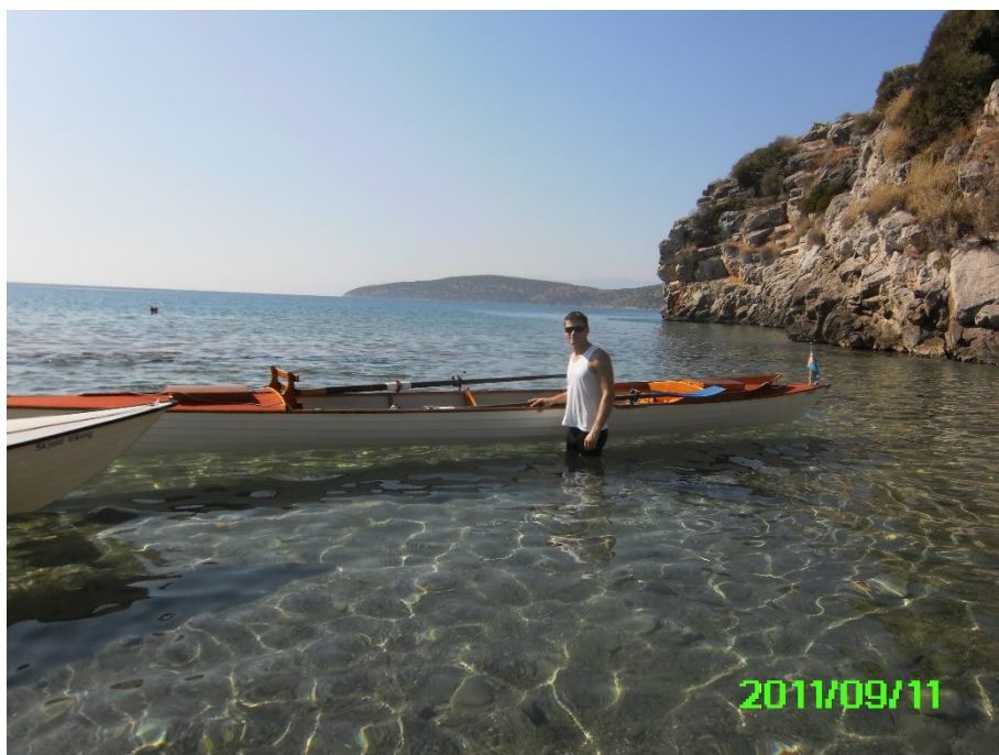
Tolo Roklub kan byde på høj sol og 25 grader her i efteråret.

Tolo Roklub ved Søren Uldall "sniger" følgende annonce med i denne reportage: Ikke mindre end 40 roere har været nede og ro i Tolo. Her i den første uge af november har temperaturen været 25+ og med høj sol... Vi har fået en rigtig lukrativ aftale med vores samarbejdspartner Hotel Taverna Romvi. Hvor går man lige hen og får overnatning i højsæsonen for ca. 185 kr. inkl. morgenmad og to retters aftensmad pr. person?? Vi kan allerede nu melde om forhåndsreservationer i 2014, så det tegner til en stor sæson 2014. Ugerne 17, 41 og 42 er reserveret.