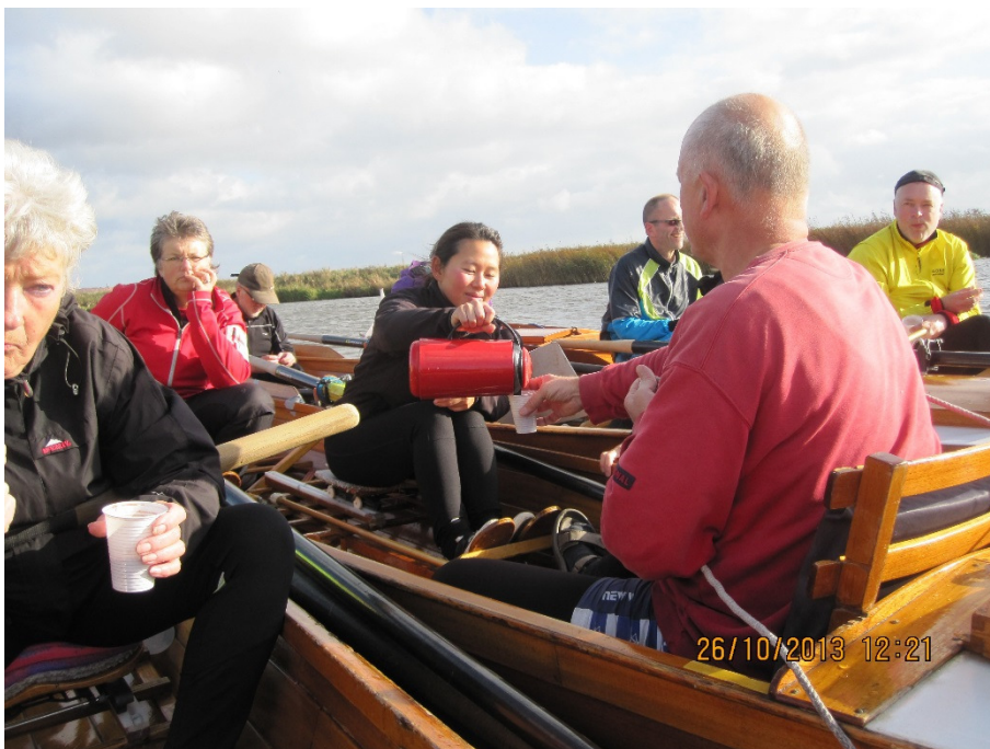
Roere fra Randers Roklub fejrer standerstrygningen og sejren i Motionsturneringen med varm chokolade og nybagte boller.