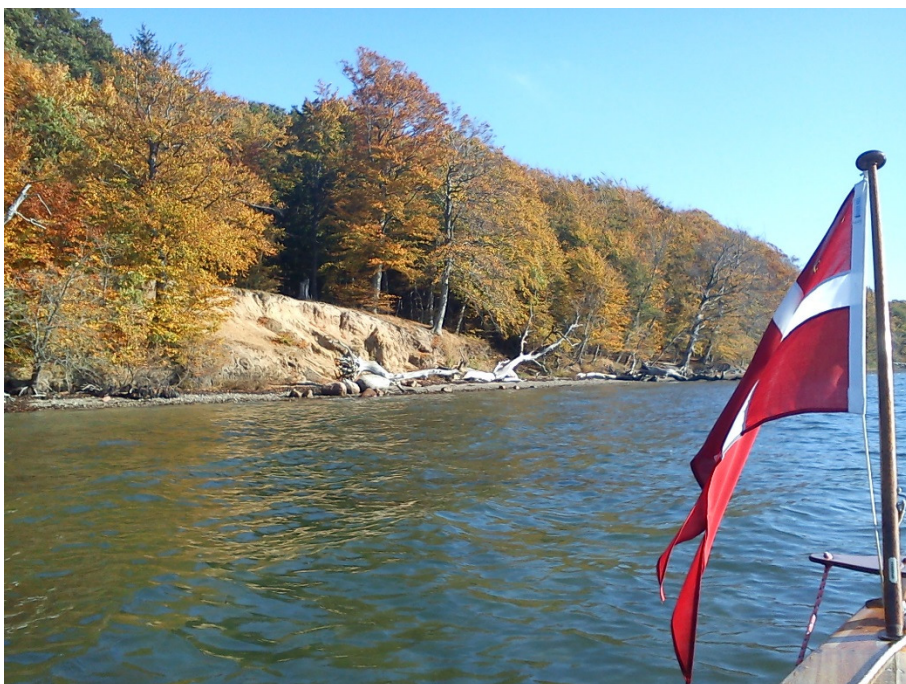
Naturens smukke efterårsfarver sat i relief af Dannebrog's klare rød/hvide farver

på tanden og er med igen til næste år. Men det vigtigste der er sket i klubben i år er, at vi er ved at få gang i en ungdomsafdeling. Sent i efteråret fik vi – blandt andet i forbindelse med et Åbent-hus-arrangement - kontakt til nogle forældre og børn som var interesserede i at gå til roning. Samtidig har vi haft tilgang af medlemmer der både har lyst, tid og interesse til at påtage sig leder-hvervet for en sådan afdeling. Vi er startet forsigtigt op her i efteråret, men der er lagt planer for vinteren, og til foråret melder vi ud for fuld kraft.