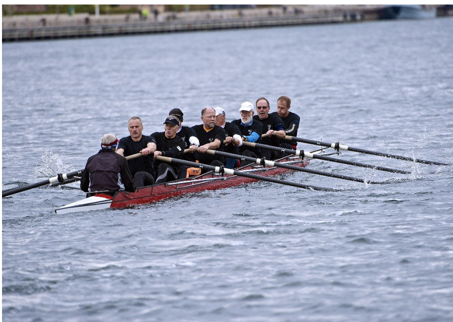
Den kombinerede otter fra Middelfart og Hvidovre ved Copenhagen Harbour Race.