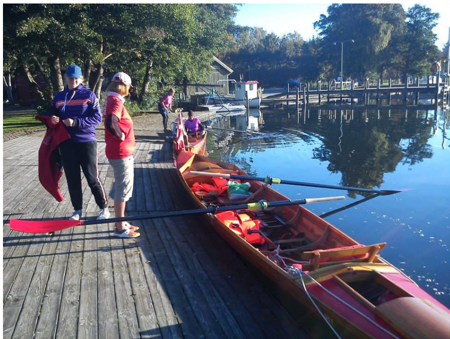
Sønderborg Roklub på løvfaldstur til Silkeborgsøerne. Man er ved at være klar til at indtage frokosten ved Kloster Mølle ved Mossø

Selvom det går tilbage for Sønderborg, der nu er nummer to i 2. division, har man alligevel haft en super sæson. Henning Plesner berette fra grænselandet: Så har vi haft standerstrygning og kan se tilbage på en 2013 super rosæson med mange kilometer. Det blev til ikke mindre end fem sølvvårer, hvoraf den ene oven i købet gik til en kaninroer. Traditionen tro blev der i denne måned roet en løvfaldstur, som i år gik til Silkeborgsøerne med Ry Roklub som base.