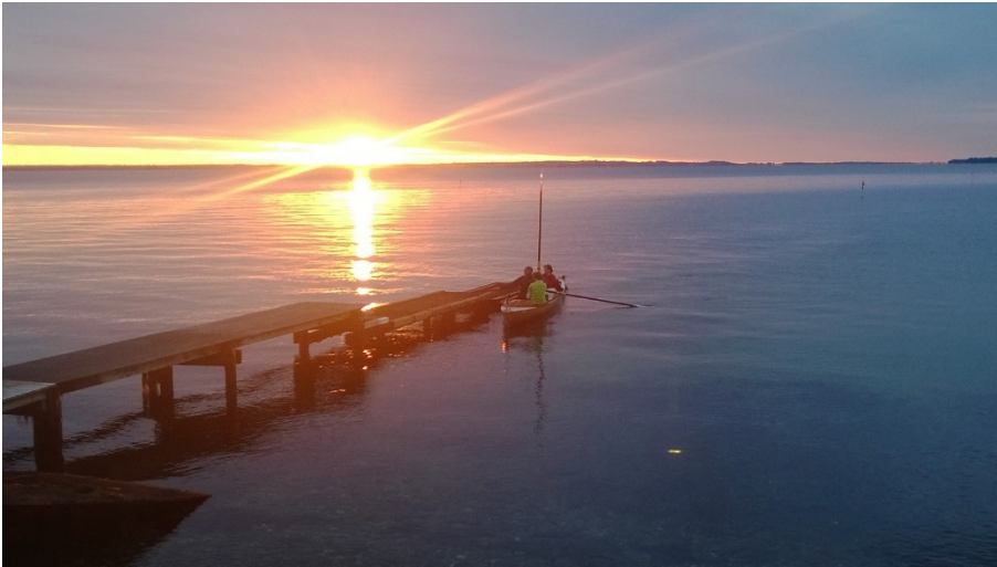
Og mere morgenstemning, her ved Humlebæk Roklub