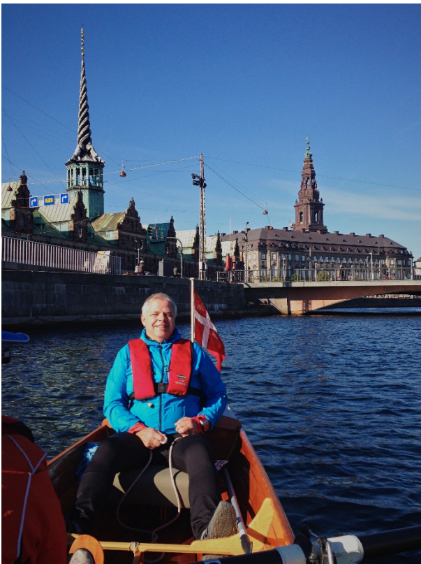
Nivå Roklub på tur på Københavns kanaler.

Så er vi allerede fremme vi sidste måned i dette års turnering. Hvis I vil have de sidste kraftanstrengelser frem i dagens lys, skal Signaturen have jeres indberetning senest søndag den 10. november kl. 24.00