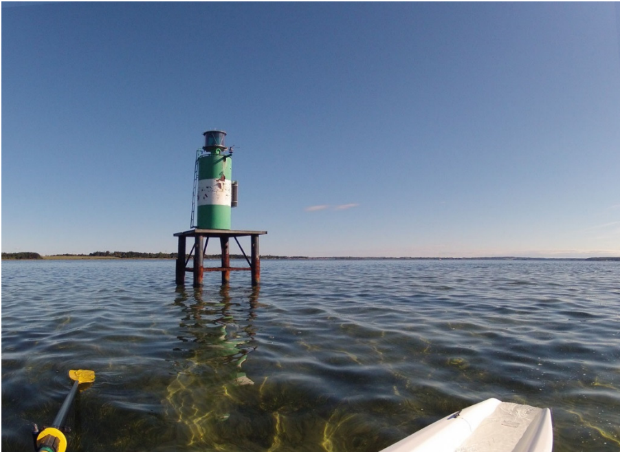
Marsmanden - sømærket i Vestrenden mellem Orø og Tusenæs

Alle deltagere melder om særdeles god betjening, god mad og til særdeles overkommelige priser på vort hotel. Hertil kommer STOR hjælpsomhed med diverse med bådene. Kort sagt ophold på Hotel Taverna Romvi hos Antonis er en god oplevelse!