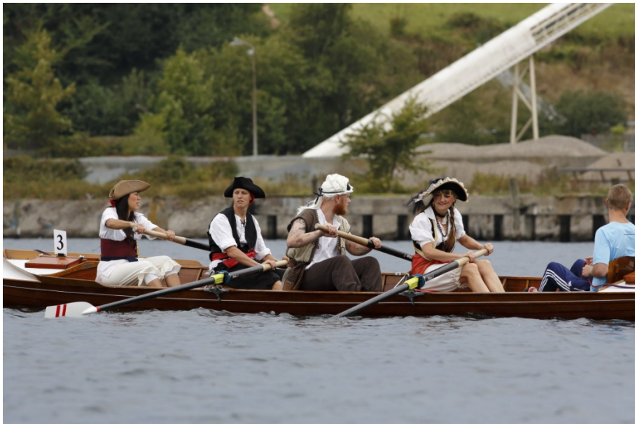
Firmakaproneing i Sønderborg Roklub.

Nykøbing S. Roklub er det eneste hold i 4. division der kan konstaterer fremgang. En plads frem til tredjepladsen er det gået for nykøbingenserne.