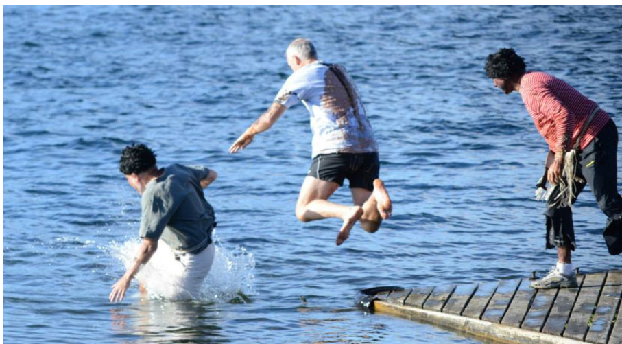
Kanindåb i Roklubben SAS

Jels Roklub og Roklubben Øresund føles ad en plads tilbage for at indtage syvende- og ottendepladserne i nævnte rækkefølge.