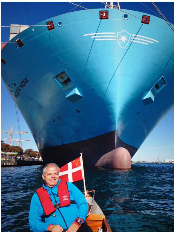
Nivå Roklub foran verdens største container skib Majestic Mærsk.