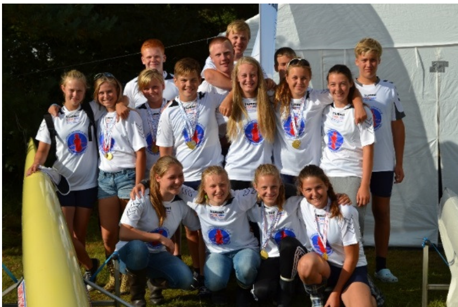
Glade årgangsmestre fra Sorø Roklub

Også i Nyborg, der har ambitioner om at slutte blandt de tre bedste, er der gang i roning. Brian R Sørensen skriver: Det ser ud til at både medlemmer, bådene og årerne i Nyborg Roklub er varmet godt op efter den noget sløve start på året. Vi er nu indstillet på at kæmpe om en top tre placering, så der bliver svedt og roet på fuld knald i Nyborg. Blandt den daglige roning mandag, tirsdag, onsdag og torsdag, har flere og flere været gode til at oprette ekstra ture i rokort.dk . Et par langture er det også blevet til. Nyborgs aktivitet belønnes med en femteplads – samme placering som sidst.