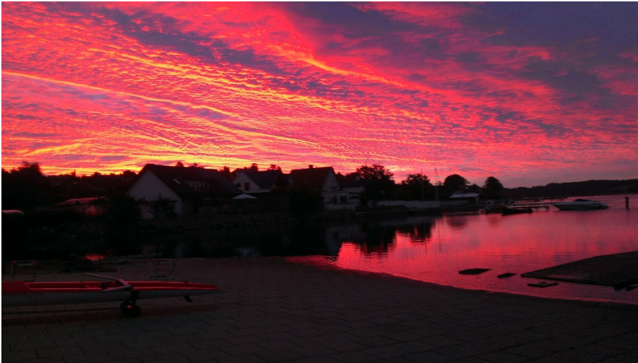
Morgenstemning ved Kolding Roklub.

til så mange kilometer, men måneden har været præget af et par rigtig gode arrangementer. Først sendte vi syv mand afsted til World Master Rowing i Varese, hvor det blev til pæne placeringer. Herudover havde vi et arrangement med "mørkeroning" til et af de mange historiske steder, der findes langs Lillebælt. Her havde vi allieret os med en lokalhistoriker, der kunne fortælle spændende fra Hindsgauls Historie. Endelig sluttede vi af med vores årlige klubkaproning, der er et rent fornøjelsesarrangement, hvor det først gælder om at deltage, og siden så kan vi tale om placering.